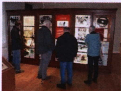
Leben eines/r Bibbesheimers/in